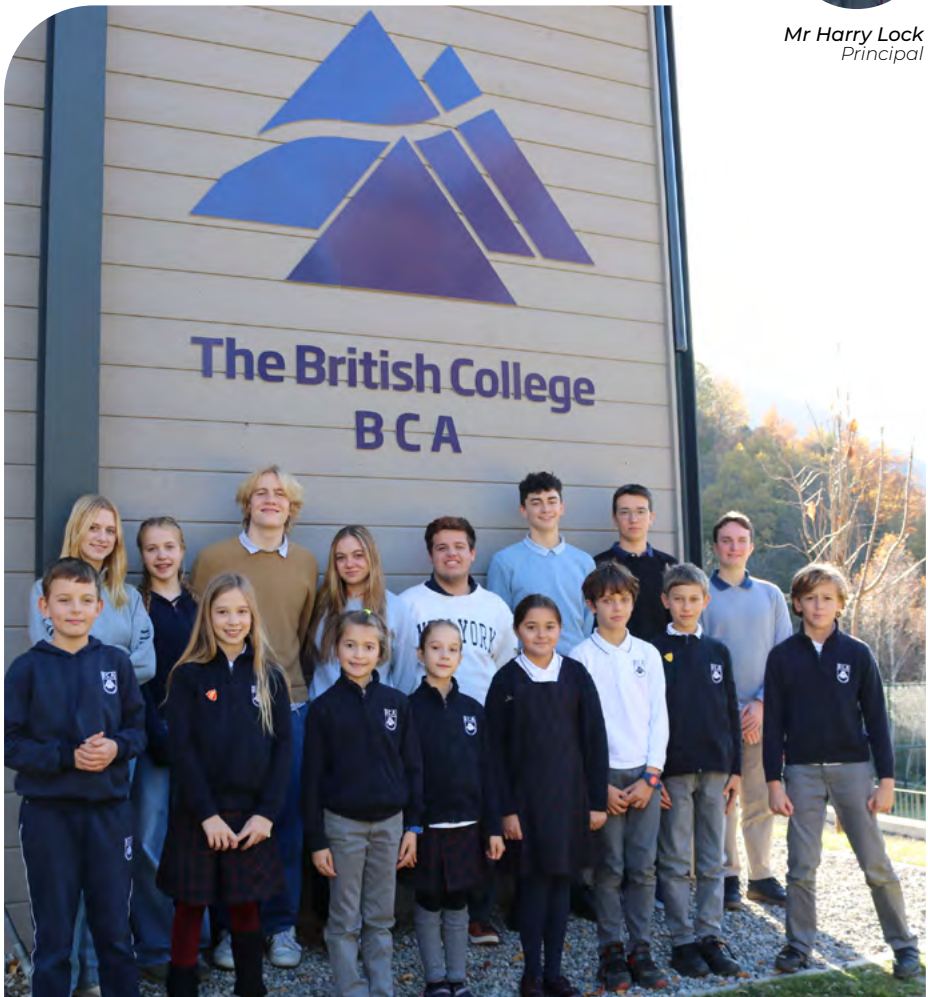
BCA House Council 24-25.