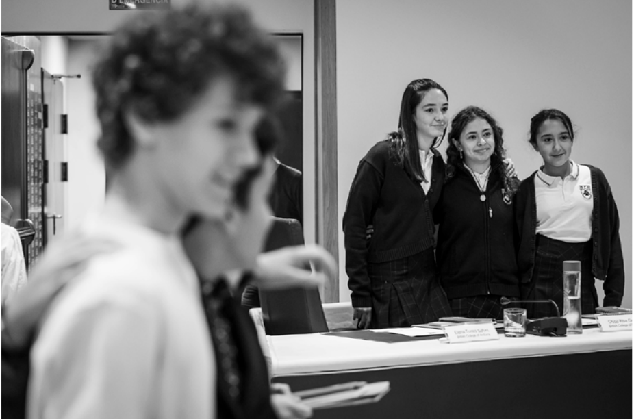
Alumnos de Year 9 en el Consell de Joves.

Los alumnos de Year 9 han representado al colegio, con mucha profesionalidad, en el Consell de Joves del Comú .