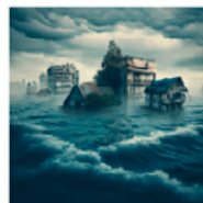
A massive flood was created by the government in 2078 to get rid of half of the population.