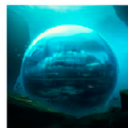
All the humans that survived now live inside a glass sphere in the ocean.