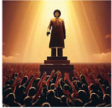
Image 6: People are forced to pray to at their great leader every day and he is the most valued thing in the world.

or also the type of artstyle you would like it to be: impressionism, cartoon, etc... In our classroom, we have recently been using AI for an assignment. The homework was to create a dystopian storyboard using AI generated images. This helped us to visualise our dystopian worlds before a creative writing assignment. Our written descriptions in our exercise books then became more vivid as we spent more time focusing on details and trying to capture everything about the image in our own dystopian story writing.